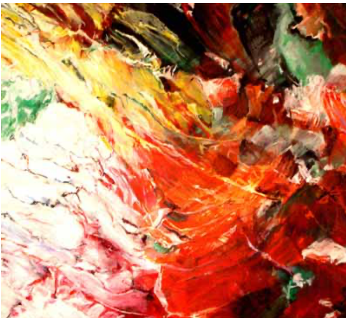
Also sprach Zarathustra, 120x130cm, Acryl auf Leinwand