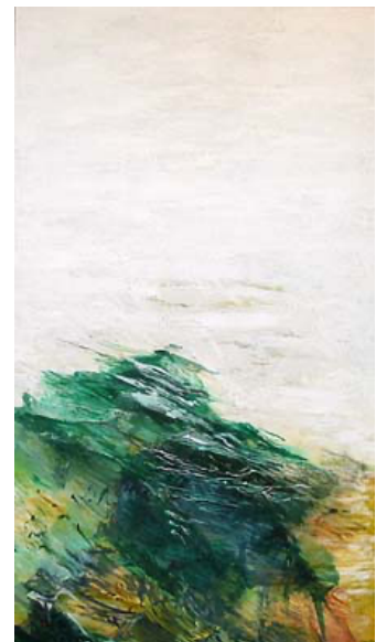
Küstenformation III, 150x70cm, Acryl auf Leinwand