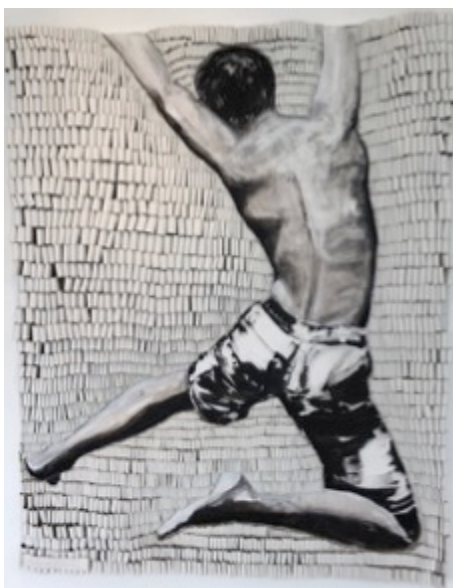
Sprung – Schlaufentechnik, Acrylfarbe 150 x 120 cm