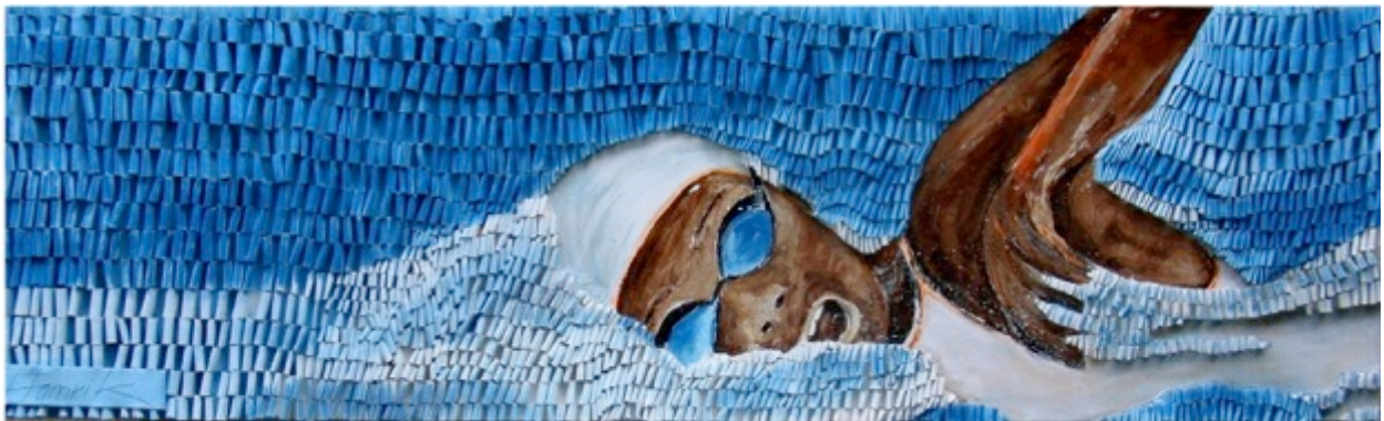
Die Kraulerin – Schlaufentechnik, Acrylfarbe – 60 x 200 cm